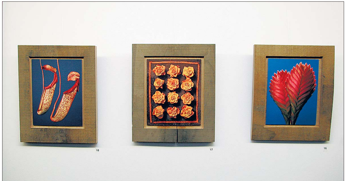
Une exposition profondément originale et d'une grâce intellectuelle inattendue.

Le regard posé sur le monde végétal est analytique et attentif. La mise en page, souvent originale, donne un impact certain à la composition. Formes étoilées, cosse de petits pois d'une clarté minutieuse, qui met la beauté de la structure naturelle en valeur, se détachent d'un gris profond ou d'un violet saturé. Le regard va vers l'essentiel, l'intérêt naît du style, de la symétrie, de la répétition. Les arrière-plans bougent – souvent complémentaires au point de vue de la couleur, ils peuvent avoir un mouvement de vagues ou encore mélanger les teintes somptueuses qui évoquent un tissu riche et épais. Il y a des poivres rouges, des arômes d'un jaune pâle très doux qui évolue vers le rouge foncé. Tulipes expressives sur bleu intense, roses poétiquement encadrées par une latte de bois à la